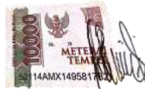
Gusti Febriyana 113063C1223006